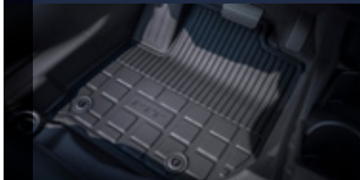
Tapete de borracha