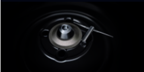
Trava antifurto do estepe