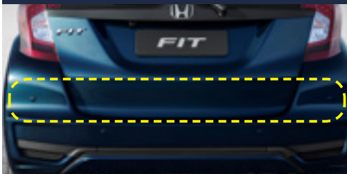
Sensor de estacionamento traseiro