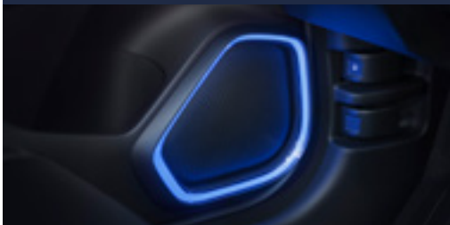
Moldura de iluminação do alto falante

O veículo também traz a combinação perfeita entre o conforto e a tecnologia para garantir a melhor experiência ao dirigir. Moldura de alto falante, soleira, console e interior podem ser iluminados de maneira única, além de contar com pedaleiras esportivas para deixar seu Honda FIT mais esportivo.