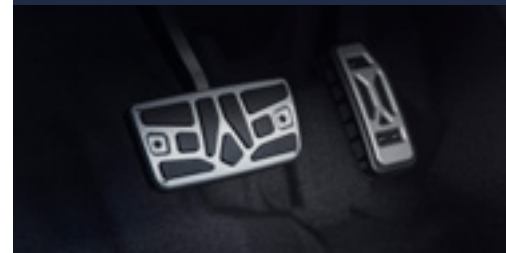
Pedaleira esportiva (CVT)