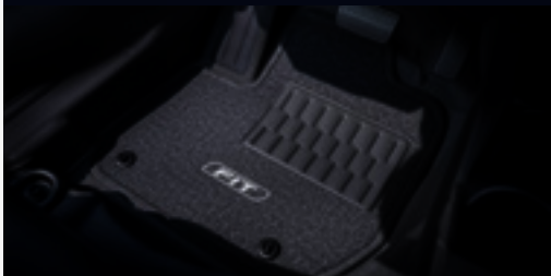
Tapete de carpete standard