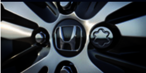
Porca antifurto para rodas