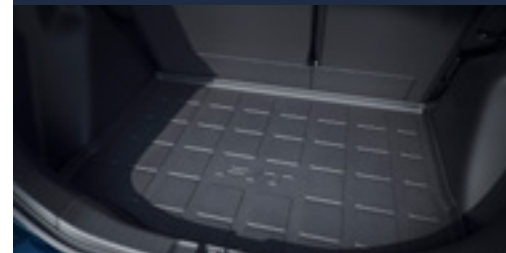
Bandeja de porta mala