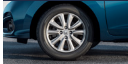
Roda de alumínio