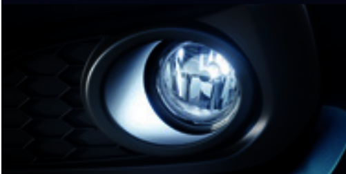
Lente em LED (Farol de Neblina)