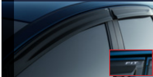
Defletor de chuva (Com logo FIT)