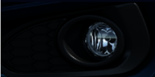
Farol de Neblina, conjunto (com lâmpada halógena)