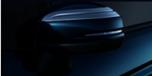
Aplique de espelho retrovisor prata