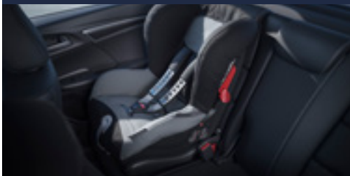
Cadeira infantil Duo Plus (com sistema de fixação ISOFIX)