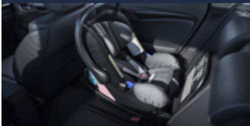
Cadeira bebê Baby Safe Plus II (com sistema de fixação ISOFIX)

O novo Honda FIT possui diversas tecnologias que garantem a segurança e o conforto de todos ocupantes, tais como as exclusivas cadeirinhas de bebê baby safe plus 6 Duo Plus . Também pensando na segurança e proteção de seu veículo, a Honda desenvolveu o Kit de Farol de neblina 6 Lente em LED , bem como as Porcas e Travas de segurança para as rodas e estepe.