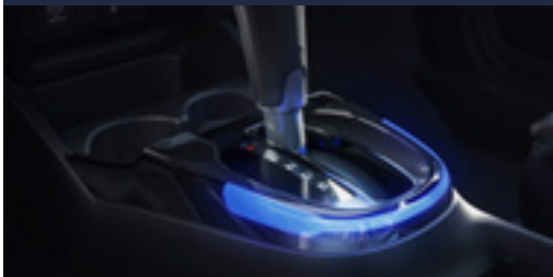
Iluminação do console