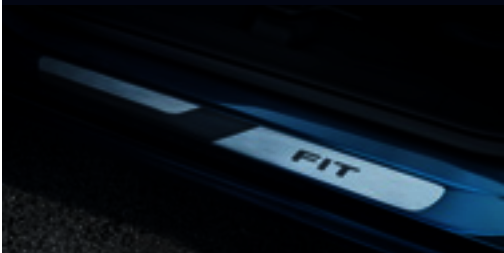
Protetor de Soleira