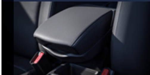
Descanço de braço